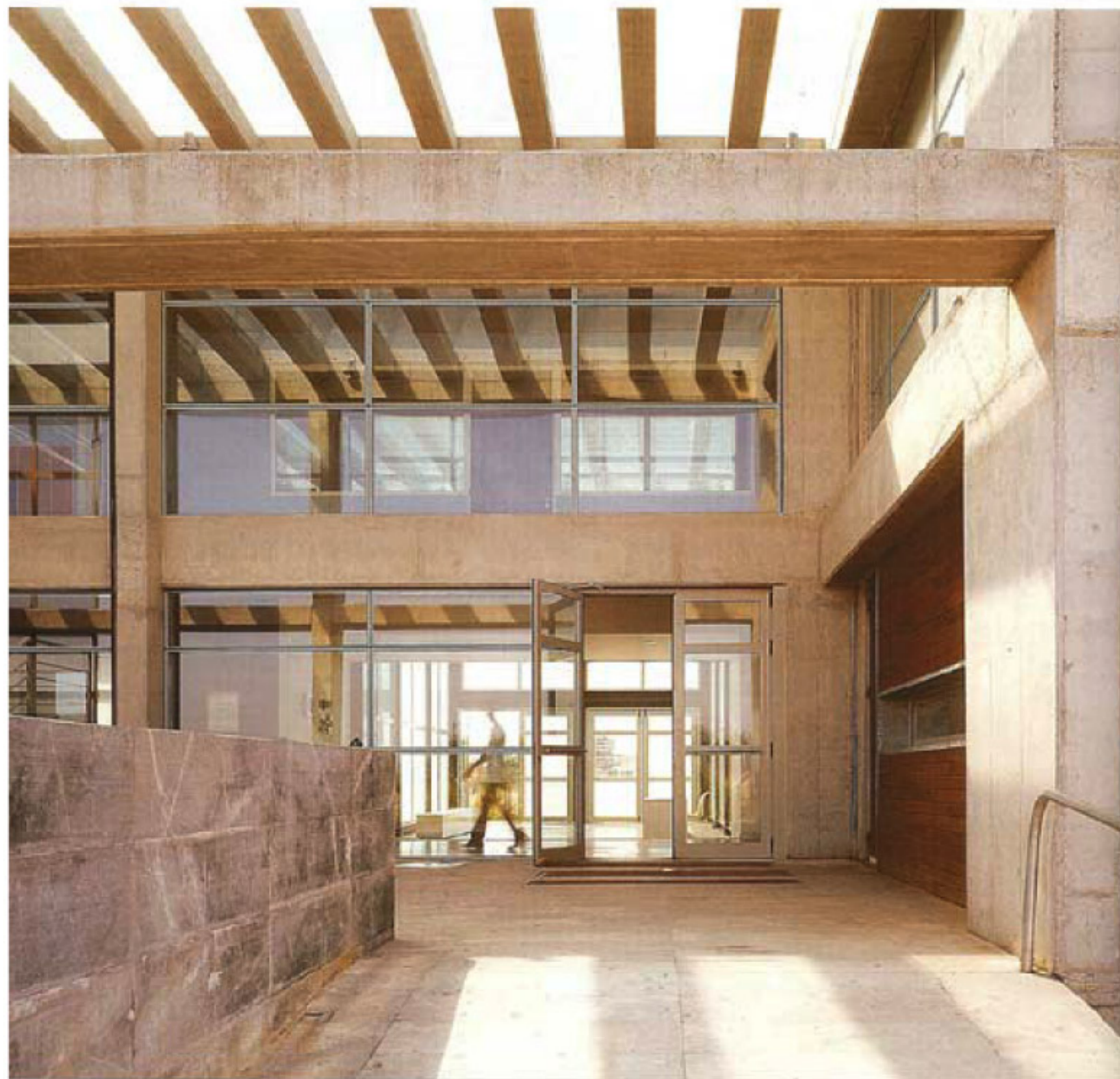
Η κεντρική είσοδος με το αθρίο.

ζουν" και να "αισθάνονται" τη διαφορετικότητα των υλικών και να αντιλαμβάνονται τη χρησιμότητα και χρηστικότητα τους σε σχέση με την τοποθέτησή τους στο κτίριο.