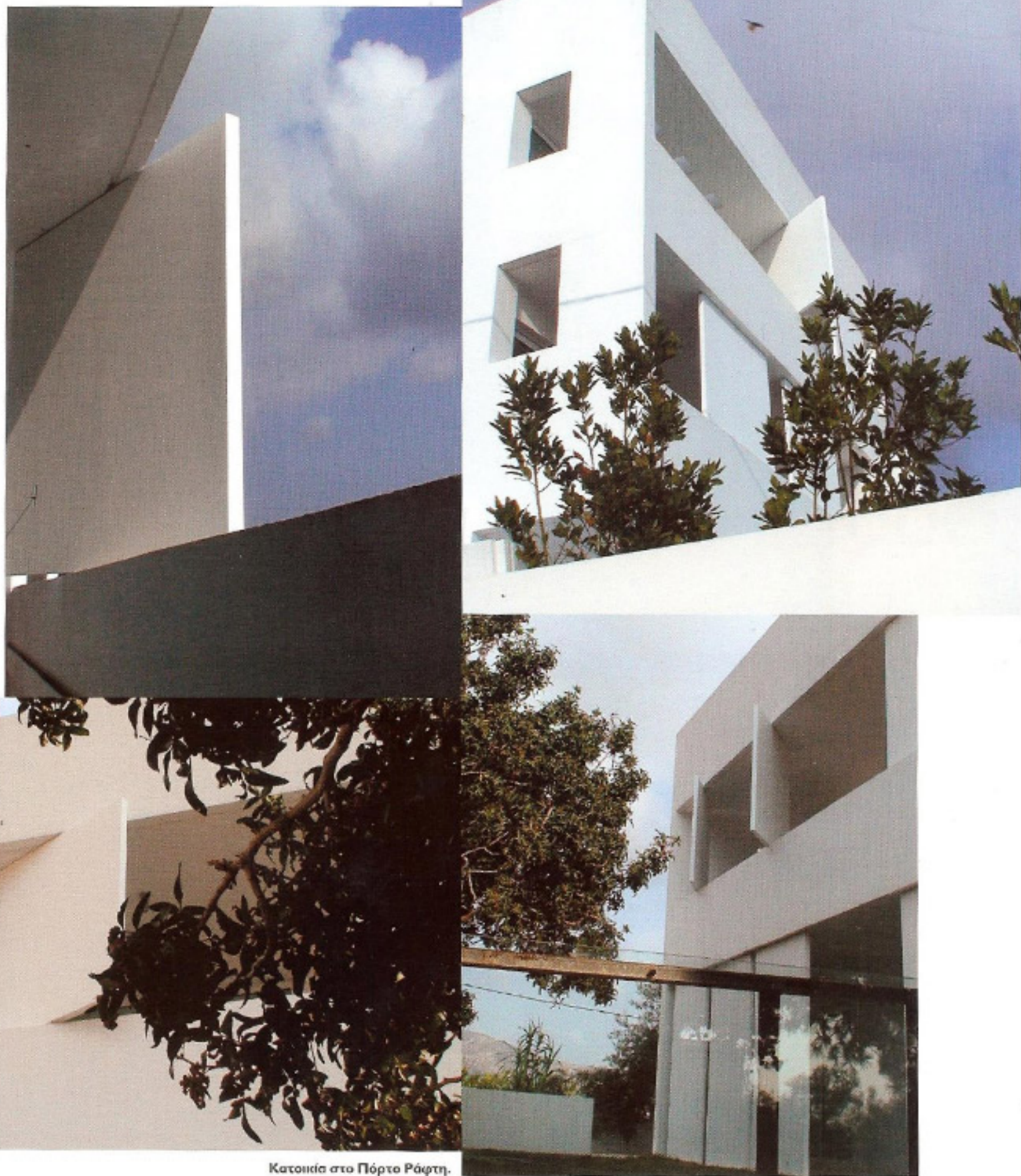
Κατοικία στο Πόρτο Ράφτη.

θα δημιουργεί νέες ερωτήσεις στο μυαλό μας. Σκοπός ενός έργου δεν πρέπει να είναι μόνο η κάλυψη αισθητικών και λειτουργικών αναγκών, αλλά και το πώς θα αφυπνίσει την καρδιά και το μυαλό του χρήστη και του παρατηρητή. Για να πετύχουμε αυτόν το σκοπό πιστεύουμε ότι πρέπει όλα τα συστατικά να είναι από την αρχή μαζί. Δεν πρέπει πρώτα να σχεδιάζεται το κτίριο, μετά να διαλέγονται τα έπιπλα και μετά να αναζητούμε ένα καλό έργο τέχνης. Θα πρέπει από την αρχή του έργου και σύμφωνα με τις προϋποθέσεις να επιλέγονται αντίστοιχα οι κατάλληλοι συνεργάτες, έτσι ώστε η μεταξύ τους συνδρομή να οδηγήσει στο ζητούμενο αποτέλεσμα. Κατά τον τρόπο αυτόν θα μπορέσουμε να αποφύγουμε την απλή συλλογή "ωραίων" αρχιτεκτονικών στοιχείων, επίπλων, αντικειμένων και έργων, ώστε να μεταβούμε σε μια πιο ενιαία πνευματικότητα. Μέσα σ' αυτό το πλαίσιο της αναζήτησης δημιουργήθηκε το workshop. Αποτελεί μια αρχή, μια βάση, ένα εργαστήριο για να ξεκινήσει η έρευνά