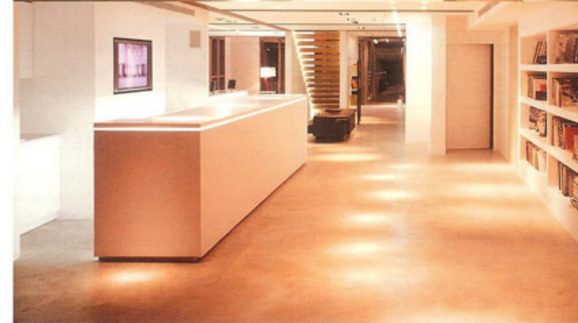
Workshop - Διονύσης Στοφίκης: Απόψεις του κτιρίου γραφείων και των εσωτερικών του χώρων.